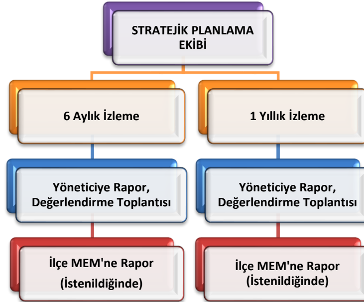
Şekil 8 Stratejik Plan İzleme ve Değerlendirme Modeli

Okulumuz Stratejik Planı izleme ve değerlendirme çalışmalarında 5 yıllık Stratejik Planın izlenmesi ve 1 yıllık gelişim planının izlenmesi olarak ikili bir ayrıma gidilecektir. Stratejik planın izlenmesinde 6 aylık dönemlerde izleme yapılacak denetim birimleri, il millî eğitim müdürlüğü ve Bakanlık denetim ve kontrollerine hazır halde tutulacaktır. Yıllık planın uygulanmasında yürütme ekipleri ve eylem sorumlularıyla aylık ilerleme toplantıları yapılacaktır. Toplantıda bir önceki ayda yapılanlar ve bir sonraki ayda yapılacaklar görüşülüp karara bağlanacaktır. 2024-2028 yıllara göre faaliyet raporları (Haziran-Temmuz) hazırlanarak İl / İlçe Milli Eğitim Müdürlüğü Strateji Geliştirme Hizmetleri Şube Müdürlüğüne gönderilmek üzere hazır tutulacaktır.